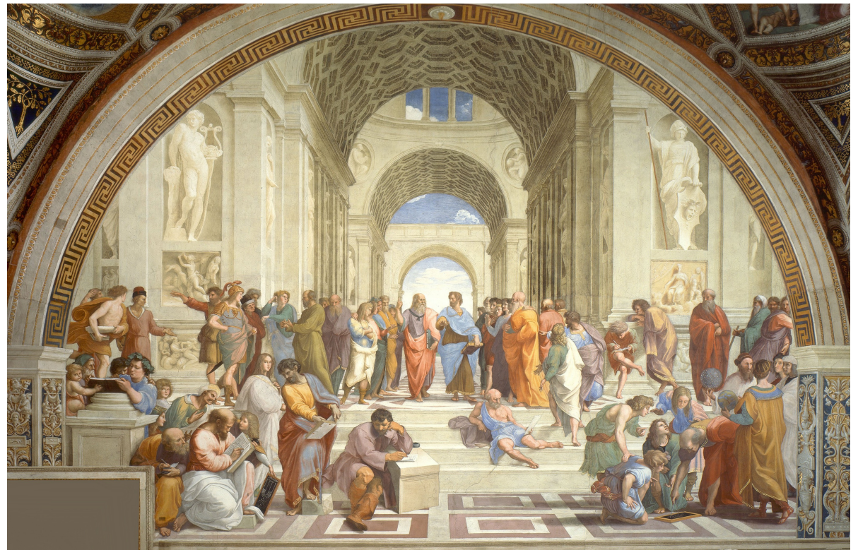
Rafael: Skolen i Athen (1509-11)