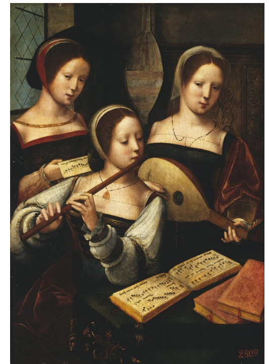
Musikanter (tidlig 1500-tall). Meester van de Vrouwelijke Halffiguren (gruppe anonyme malere)